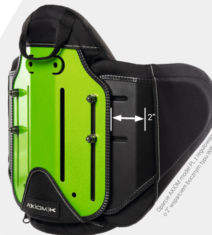
Oparcie AXIOM model PL z regulowanym o 2" wsparciem bocznym typu WINGS

Oparcie Axiom for Kids rośnie razem z dzieckiem. Dzięki regulacji głębokości i szerokości łatwo dopasujesz je do potrzeb malucha. Specjalnie zaprojektowany kształt oparcia zapewnia stabilne i wygodne podparcie, a miękka i przewiewna tapicerka gwarantuje komfort podczas każdej zabawy i codziennych aktywności.