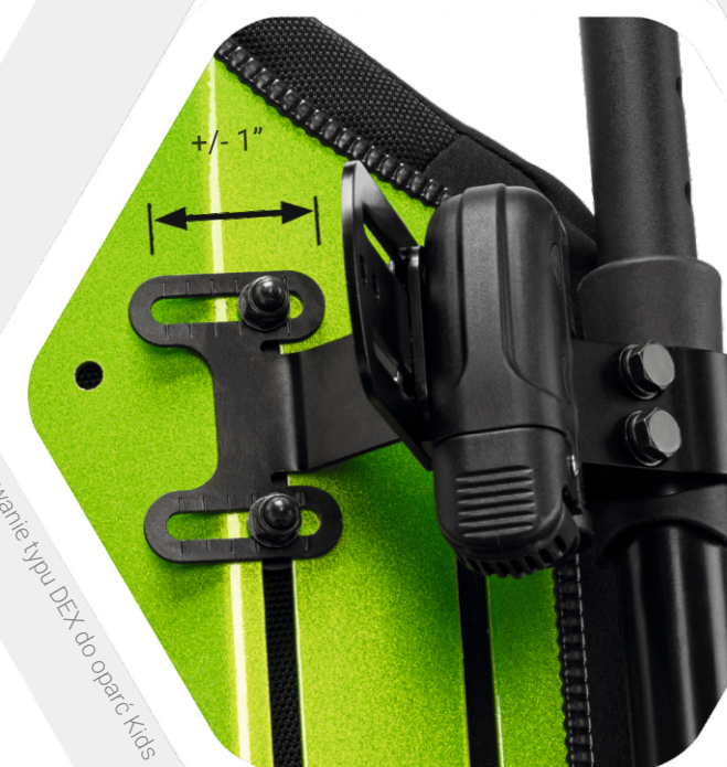
Mocowanie typu DEX do oparcia Kids

Konfiguracja i dopasowanie oparcia do wzrostu dziecka są proste dzięki intuicyjnej regulacji głębokości, kąta oraz możliwości zmiany szerokości siedziska o \pm 1" . Dzięki trzem modelom i trzem opcjom bocznym Axiom for Kids oferuje najbardziej wszechstronną gamę siedzisk dla dzieci na rynku.