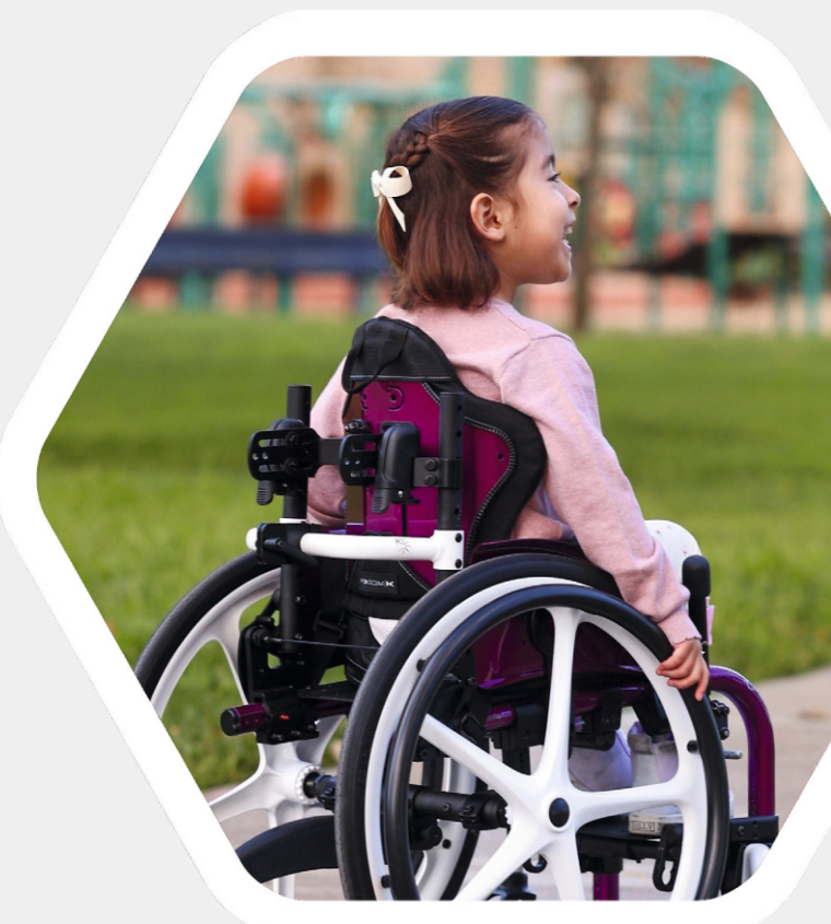
Na zdjęciu Little Wave Click z oparciem AXIOM model PL

Mocowanie DEX for Kids jest kompatybilne ze wszystkimi średnicami rur i wykorzystuje zacisk blokujący DEX 1", zapewniając pewne trzymanie przy minimalnym wpływie na oparcie. Dzięki temu oparcie można łatwo zamontować dokładnie tam, gdzie najlepiej pasuje. Dodatkowo DEX for Kids wyposażono w standardową blokadę, która zapobiega przypadkowemu odłączeniu oparcia.